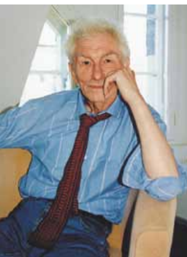
Imants Ziedonis (1933-2013)