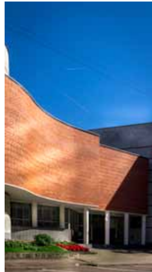
Jaunā Akadēmiskās (Misiņa) bibliotēkas ēka Rūpniecības ielā