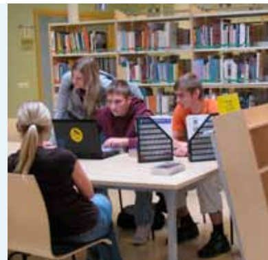
Valmieras integrētās bibliotēkas lasītavā

Par bibliotēku arī sauc ēku vai telpu, kurā atrodas šī iestāde vai tās daļa. Un visbeidzot – par bibliotēku dēvē grāmatu krājumu, kas paredzēts sabiedriskai vai vienīgi personiskai lietošanai. Bieži šāds krājums tiek īpaši sistematizēts jeb sakārtots.