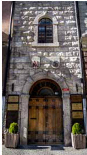
Bijušās Misiņa bibliotēkas ēkas Skolas ielā fasādes fragments