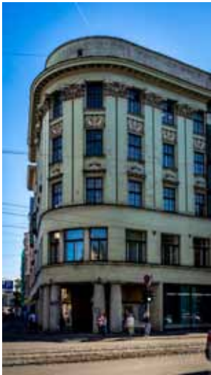
Vecā Latvijas Nacionālās bibliotēkas ēka K. Barona un Elizabetes ielas stūrī