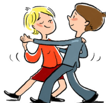
Элза и Жанис